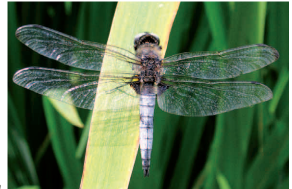
Der Spitzenfleck, eine der vielen Großlibellen