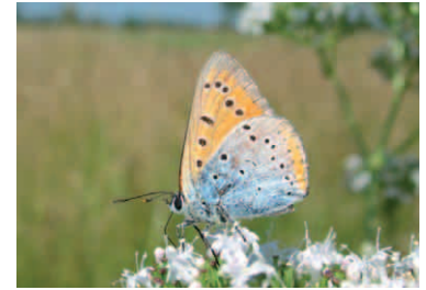
Großer Feuerfalter (li. Ober- und re. Unterseite), er gehört zur Familie der Bläulinge.